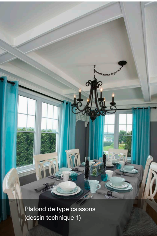
Plafond de type caissons (dessin technique 1)