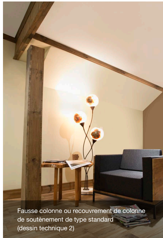
Fausse colonne ou recouvrement de colonne de soutènement de type standard (dessin technique 2)