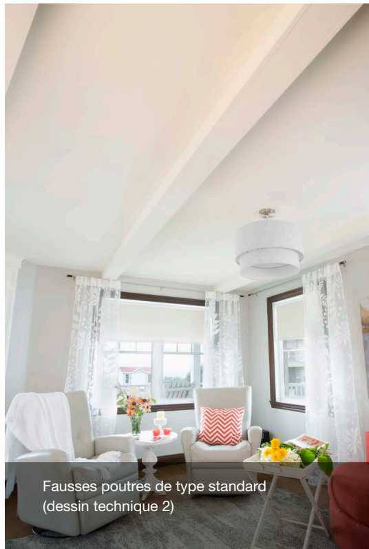
Fausse poutres de type standard (dessin technique 2)